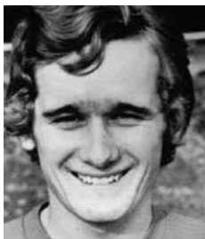
Allan Simonsen Cheftræner for VB i 1991 og for Færøerne i 1994.