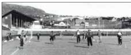
Det færøske nationalstadion i Toftir.